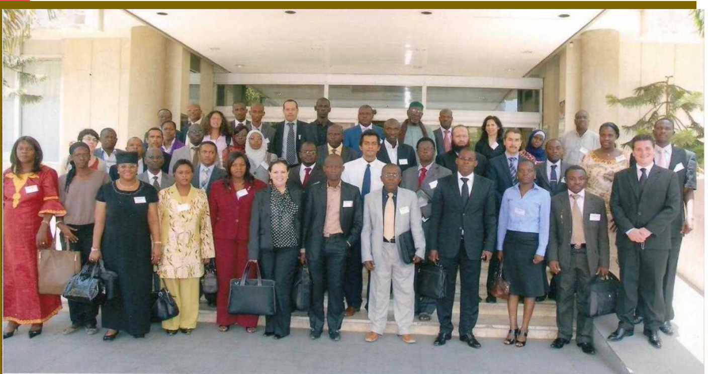
ATELIER REGIONAL DE L'OMC SUR LES MARCHES PUBLICS A L'INTENTION DES PAYS AFRICAINS FRANCOPHONES DAKAR , SENEGAL , DU 23 AU 25 AVRIL 2013

Refira-se que Cabo Verde, assim como vários países em desenvolvimento, não é signatário do Acordo. No continente africano, Camarões é o único país com estatuto de observador desde 2001.