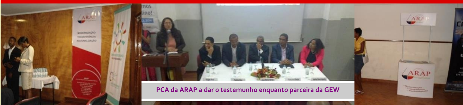
PCA da ARAP a dar o testemunho enquanto parceira da GEW